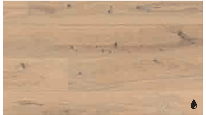
Eiche rustikal pure 8484 | gebürstet | naturgeölt | PD 200