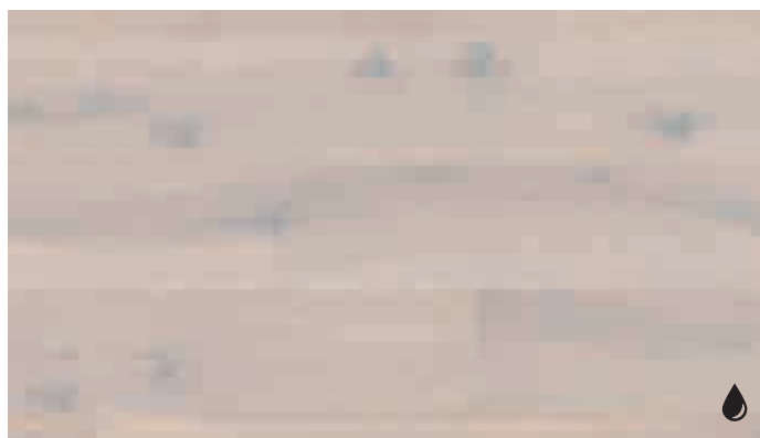
Eiche rustikal arcticweiß 8455 | gebürstet | naturgeölt | PD 200