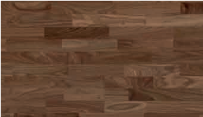
Nussbaum amerikanisch harmonisch 960 | lackiert | PC 200