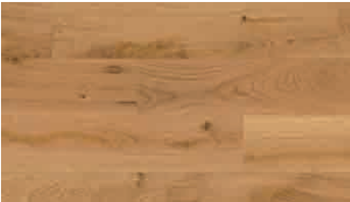
Eiche markant 8536 | gebürstet | mattlackiert | PD 150