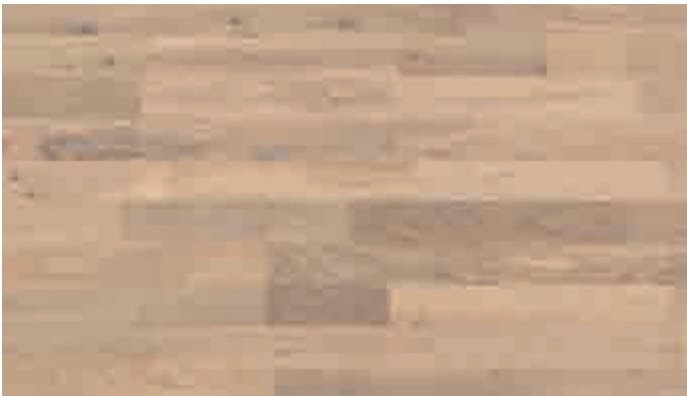
Eiche lebhaft pure 8478 | gebürstet | lackiert | PC 200