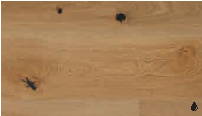
Eiche rustikal 8166 | gebürstet | naturgeölt | PD 200