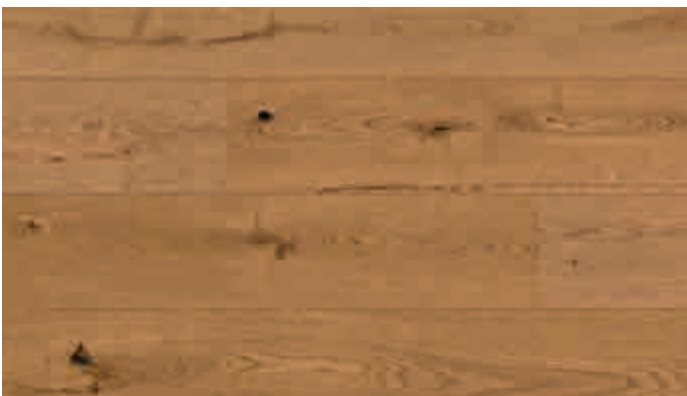
Eiche rustikal goldbraun 8487 | gebürstet | mattlackiert | PD 200