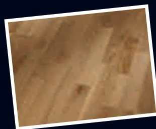
Mattlackiert | Matte Optik | Besonders strapazierfähig | Pflegeleicht