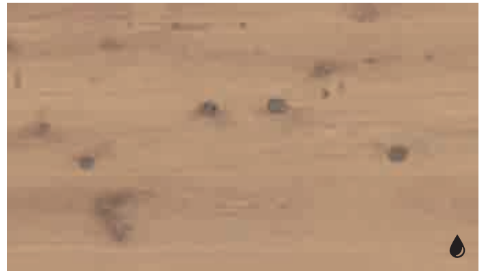
Eiche rustikal karamell 8457 | gebürstet | naturgeölt | PD 200