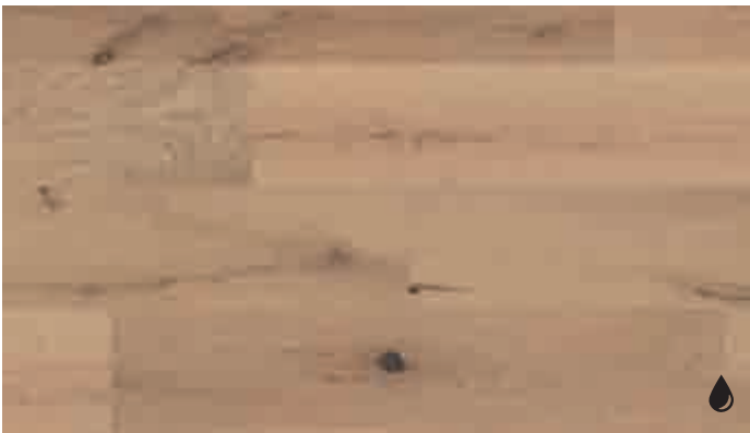
Eiche markant karamell 8534 | gebürstet | naturgeölt | PD 150