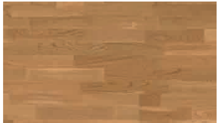
Eiche harmonisch 910 | lackiert | PC 200