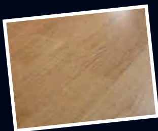
Lackiert | Leichter Glanz | Besonders strapazierfähig | Pflegeleicht