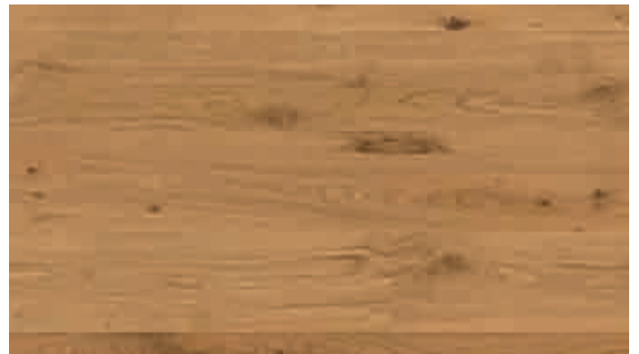
Eiche rustikal 8137 | gebürstet | mattlackiert | PD 200