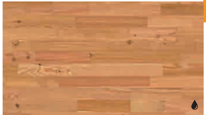
Lärche lebhaft 8472 | gebürstet | naturgeölt | PC 200