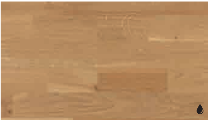
Eiche lebhaft 8187 | gebürstet | naturgeölt | PC 200