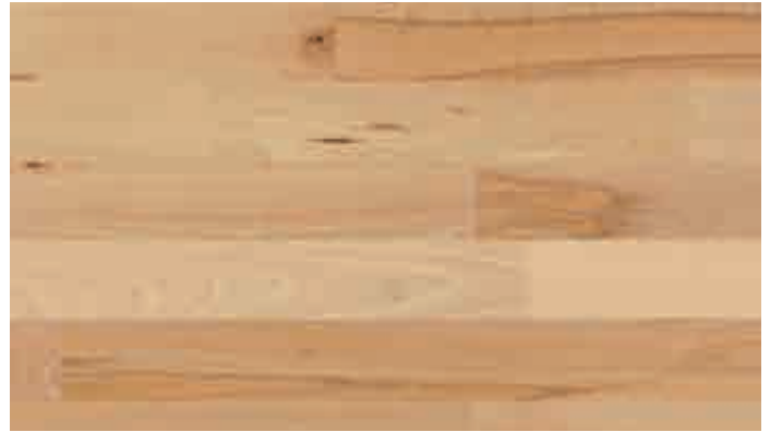
Buche lebhaft 918 | lackiert | PC 200