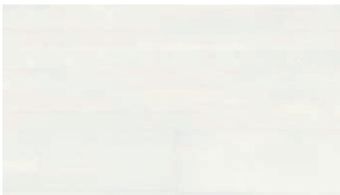
Eiche lebhaft polarweiß 8452 | gebürstet | lackiert | PC 200