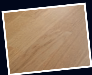
Naturgeölt | Matte Optik | Betont natürliche Holzstruktur

Die Versiegelung beeinflusst Optik und Pflegeleichtigkeit.