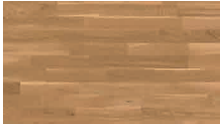
Eiche lebhaft 903 | lackiert | PC 200