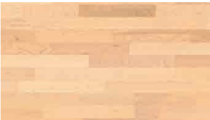
Ahorn kanadisch harmonisch 943 | lackiert | PC 200