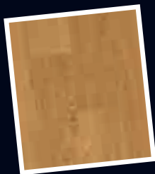
Harmonisch Für ein gleichmäßiges Gesamtbild

Die Sortierung bestimmt die Wirkung des Parkettbodens.