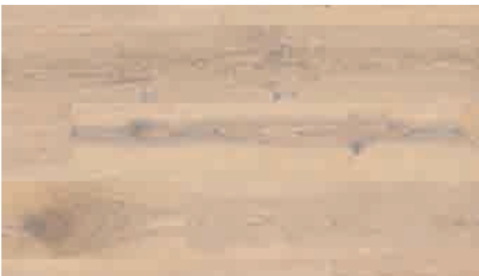
Eiche markant cremeweiß 8539 | gebürstet | mattlackiert | PD 150