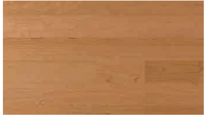
Kirschbaum amerikanisch harmonisch 945 | lackiert | PC 200