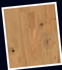
Lebhaft Für einen natürlichen Holzcharakter