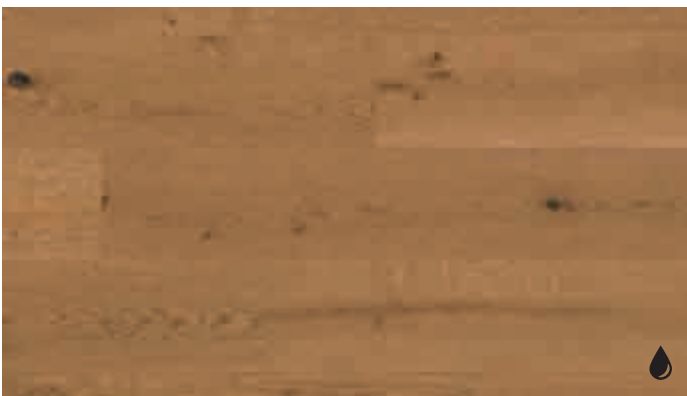
Eiche markant goldbraun 8533 | gebürstet | naturgeölt | PD 150