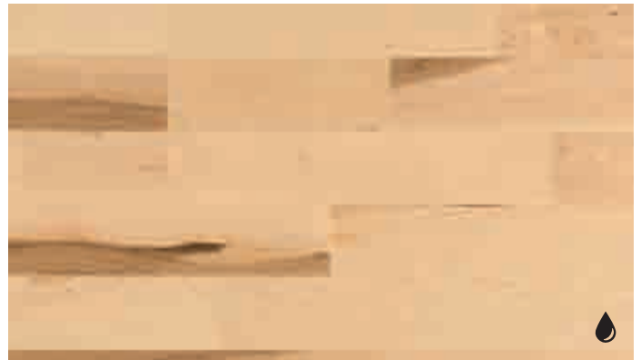
Ahorn kanadisch lebhaft 8177 | naturgeölt | PC 200