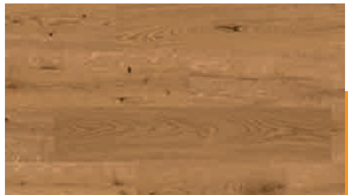
Eiche markant goldbraun 8537 | gebürstet | mattlackiert | PD 150