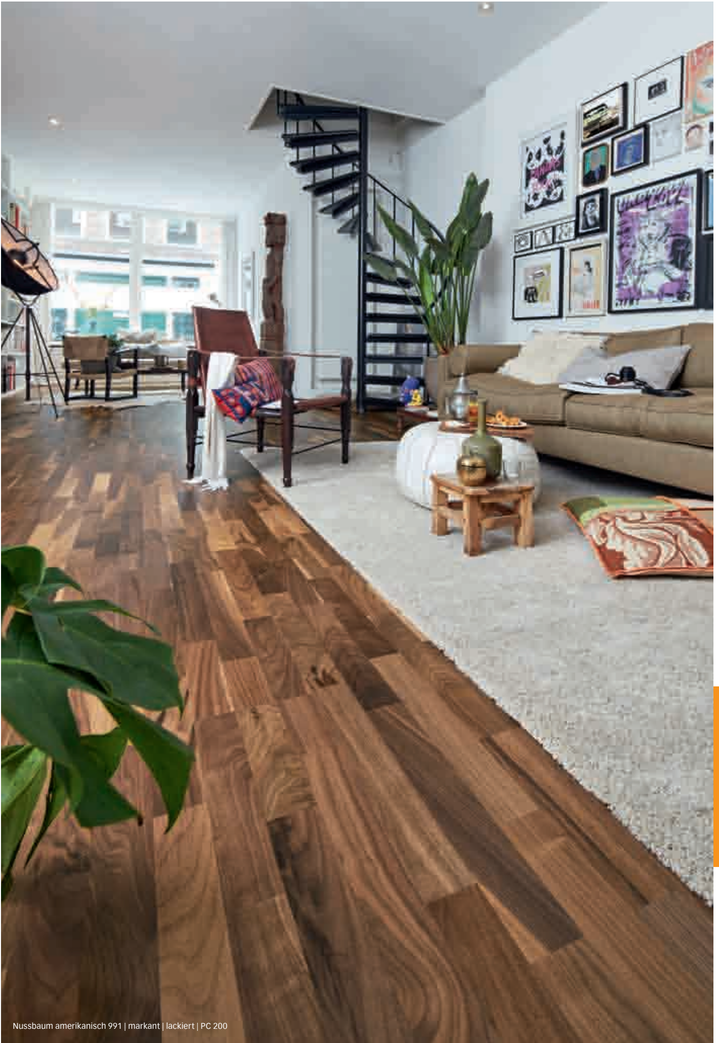
Nussbaum amerikanisch 991 | markant | lackiert | PC 200