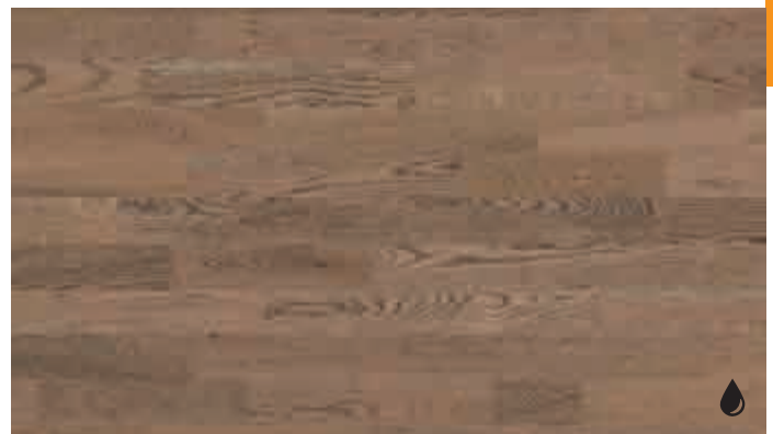
Eiche lebhaft tabakgrau 8474 | gebürstet | naturgeölt | PC 200