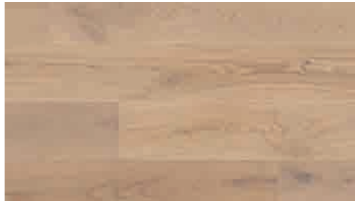
Eiche rustikal karamell 8462 | gebürstet | mattlackiert | PD 200