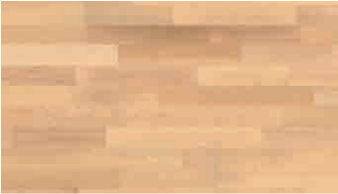
Buche harmonisch 913 | lackiert | PC 200