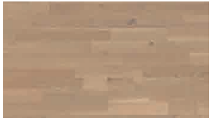
Eiche lebhaft karamell 8459 | lackiert | PC 200