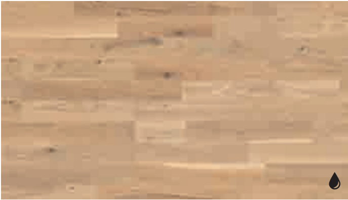
Eiche lebhaft pure 8471 | gebürstet | naturgeölt | PC 200