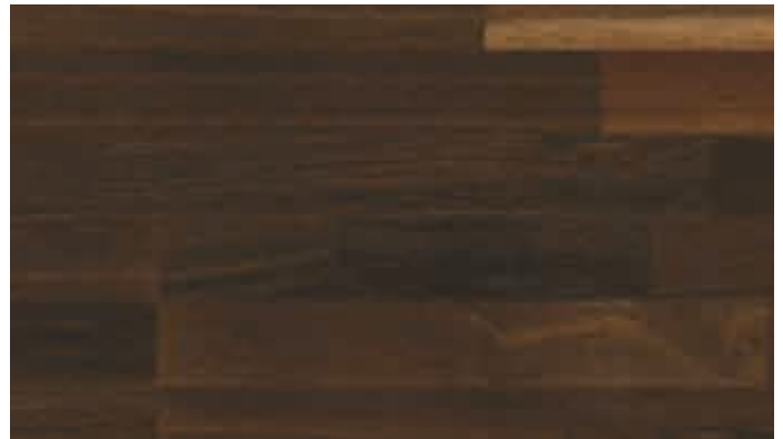
Eiche lebhaft kerngeräuchert 8105 | gebürstet | lackiert | PC 200