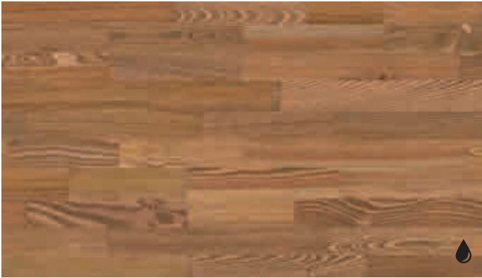
Lärche lebhaft goldbraun 8473 | gebürstet | naturgeölt | PC 200