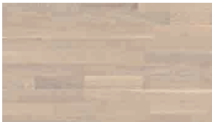
Eiche lebhaft weiß gekälkt 8480 | lackiert | PC 200