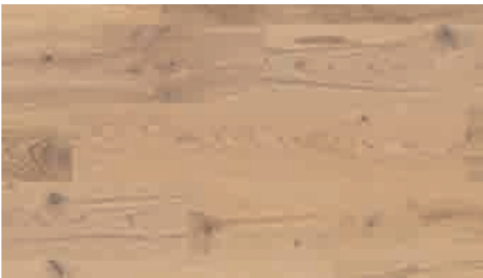
Eiche markant karamell 8538 | gebürstet | mattlackiert | PD 150