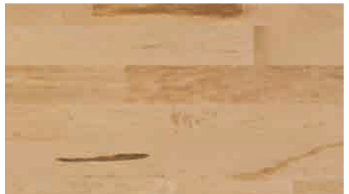
Ahorn kanadisch lebhaft 934 | lackiert | PC 200