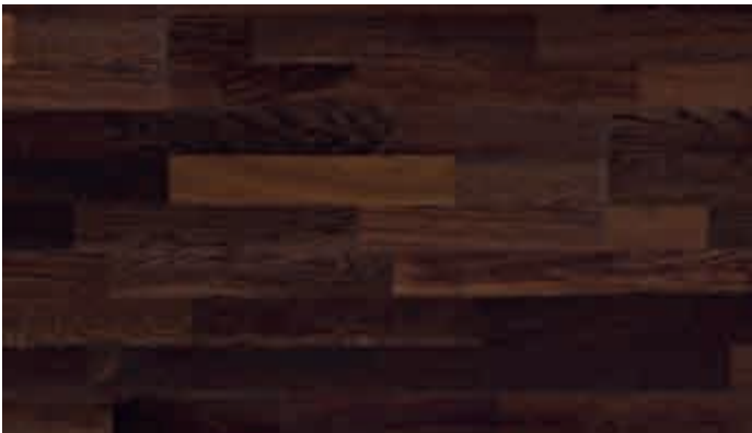
Eiche harmonisch kerngeräuchert 8021 | gebürstet | lackiert | PC 200