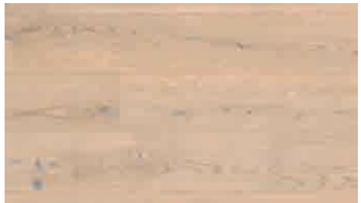
Eiche rustikal cremeweiß 8489 | gebürstet | mattlackiert | PD 200