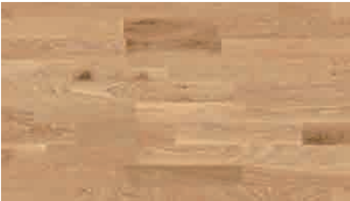
Eiche lebhaft gekälkt 8479 | lackiert | PC 200