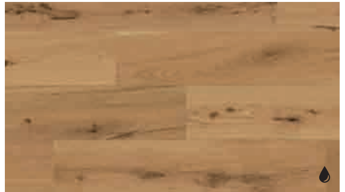
Eiche markant 8532 | gebürstet | naturgeölt | PD 150