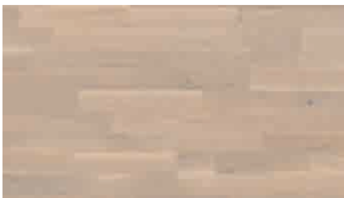
Eiche lebhaft cremeweiß 8460 | lackiert | PC 200