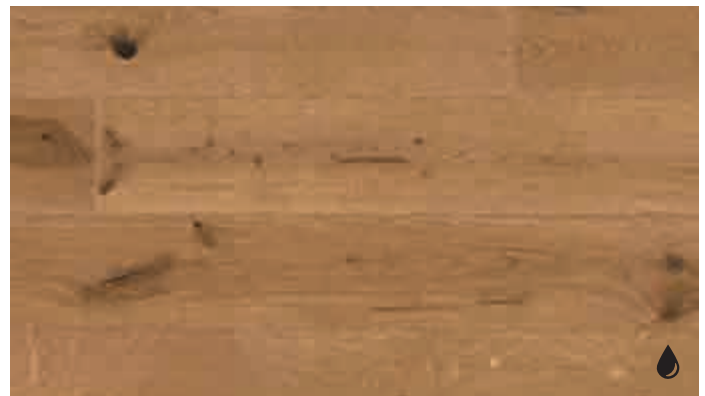
Eiche rustikal goldbraun 8485 | gebürstet | naturgeölt | PD 200