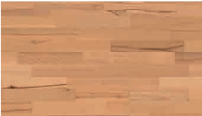
Buche lebhaft gedämpft 921 | lackiert | PC 200