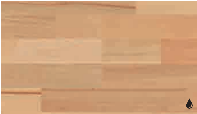
Buche lebhaft gedämpft 8186 | naturgeölt | PC 200