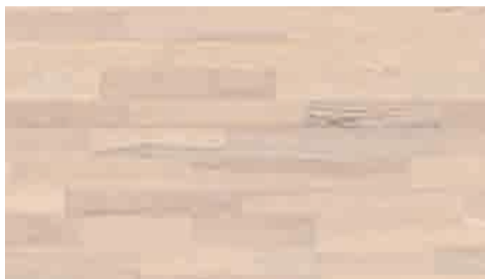
Esche lebhaft weiß 8476 | lackiert | PC 200