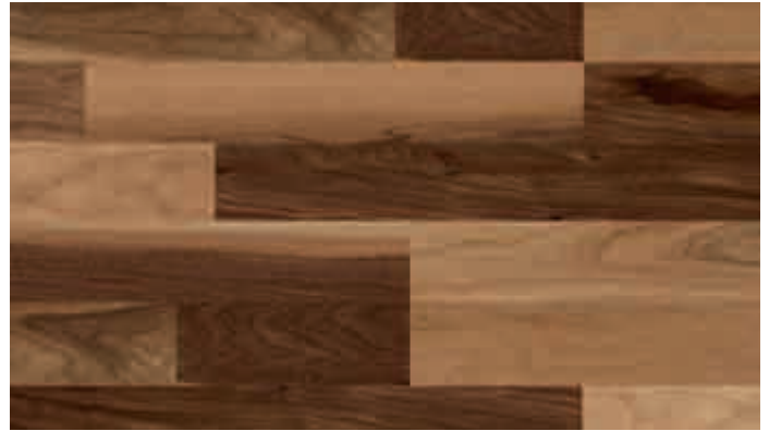
Nussbaum amerikanisch markant 991 | lackiert | PC 200