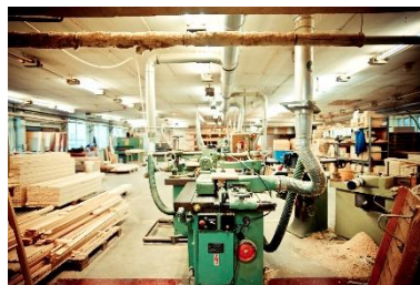
in Deutschland hergestellt