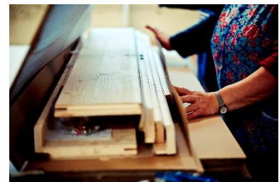
100% ökologisches Massivholz

Deine Tür bietet als Onlinehändler für Türen und Zargen eines der größten Produktangebote im deutschsprachigen Internet. Der Onlineshop ist in Deutschland, Österreich und der Schweiz zu erreichen und zu 100% Tochtergesellschaft eines Türenherstellers für Massivholztüren. Markenhersteller setzen deshalb auf die Fachhandel-Expertise von DEINE TÜR.