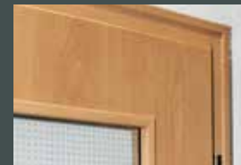
Dichtungsprofil ersetzt Vorlegeband

Infos zu Modell-Varianten und Anlieferung auf der Rückseite »