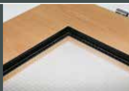
Glasleisten Trägerprofil vormontiert

bei Montage mit Westag-Klippsystem-Glasleiste KS80