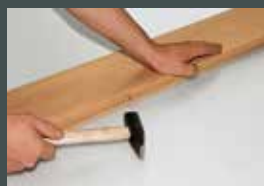
Glasleiste nageln bei eingebautem Glas (Risiko)