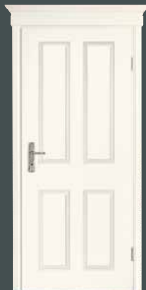
| Typ 4004 | mit Zargenapplikation Klassik