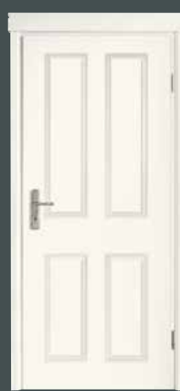
| Typ 4004 | mit Zargenapplikation Landhaus